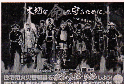
<B3・A3 サイズポスター>