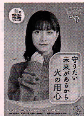
<B2・B3 サイズポスター>