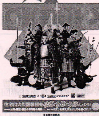
<B2・B3・A3 サイズポスター>