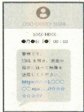
▲SMS受信画面のイメージ