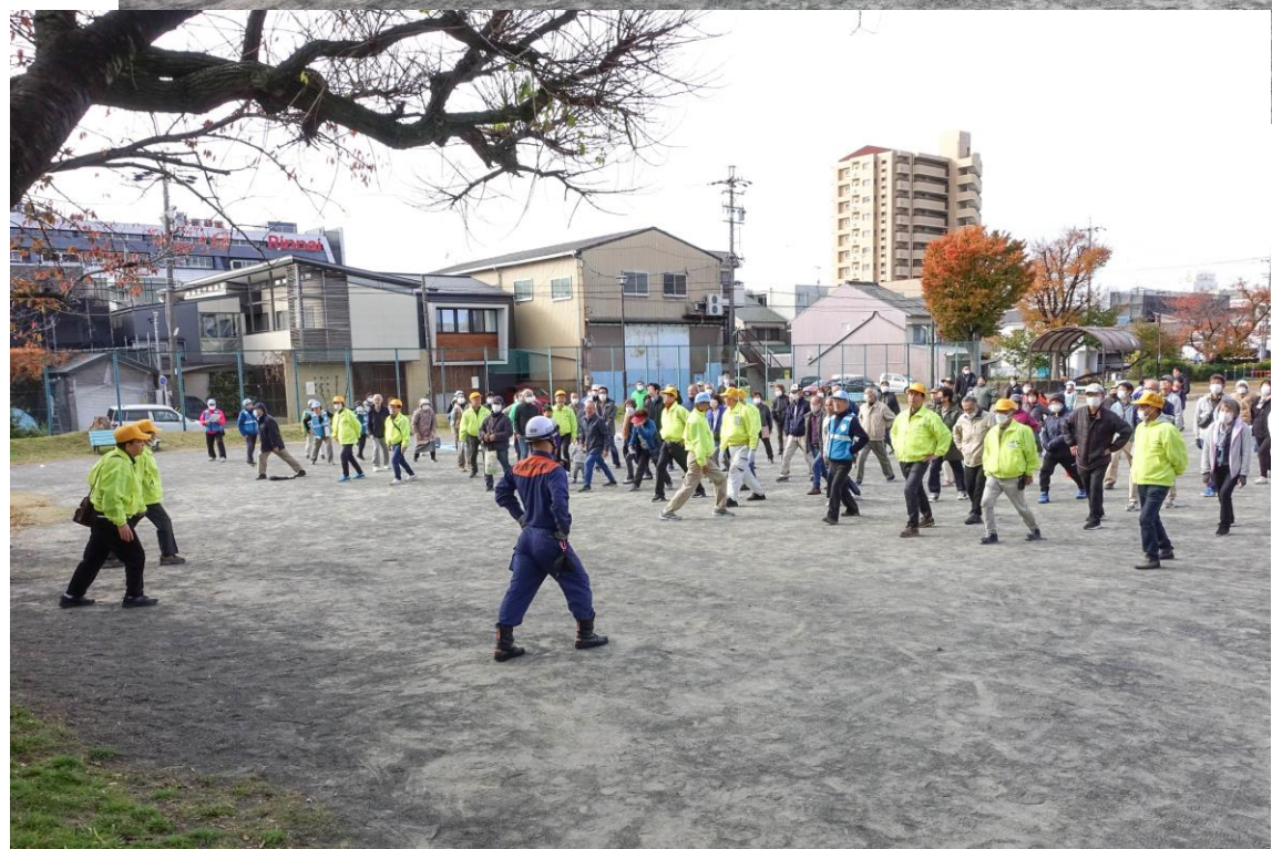
各町内自主 防災会標旗