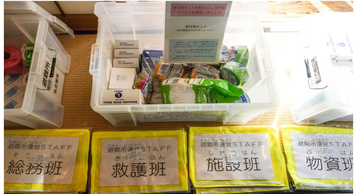
「災害救助用衛生用品」