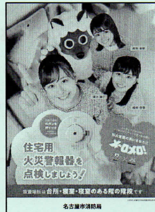
<B2・B3・A3 サイズポスター>