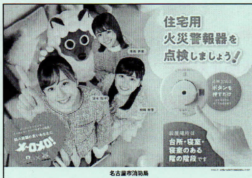
<B3・A3 サイズポスター>