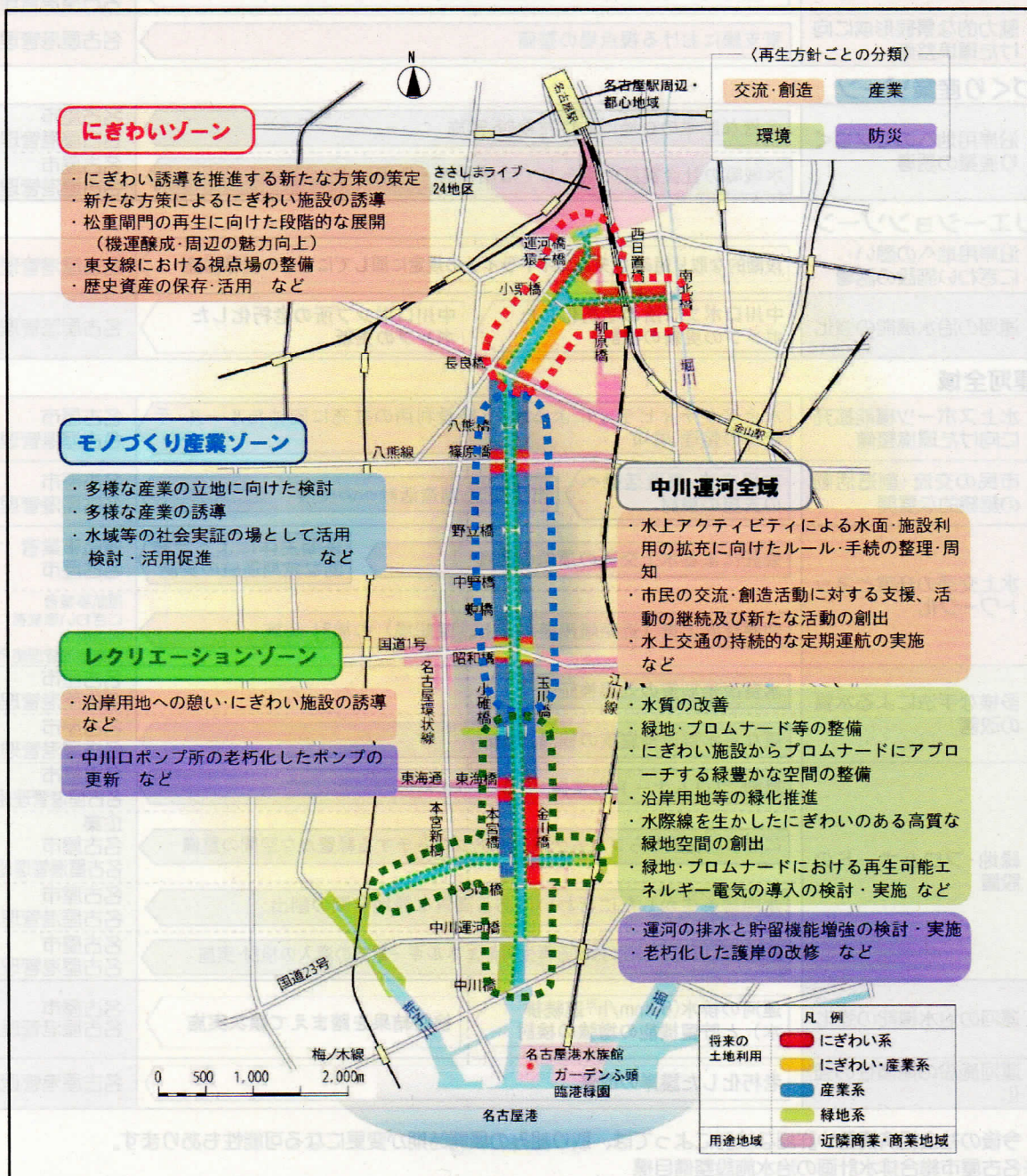
図2 今後概ね10年間の主な取り組み内容