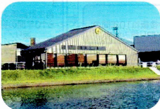
沿岸用地に誘導されたにぎわい施設