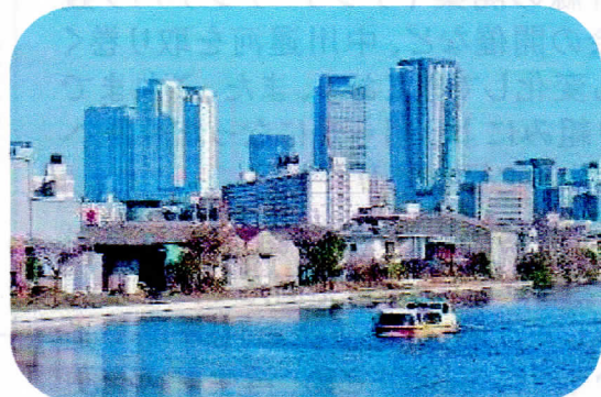
水上交通(クルーズ名古屋)