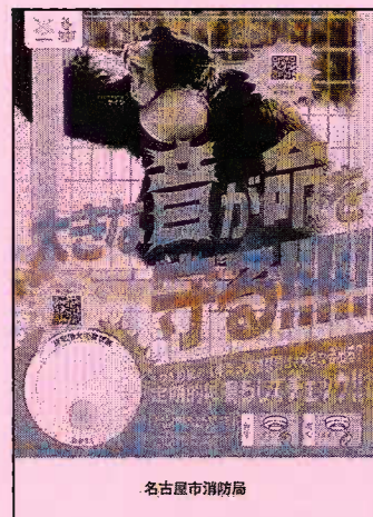
<B2・B3・A3 サイズポスター>