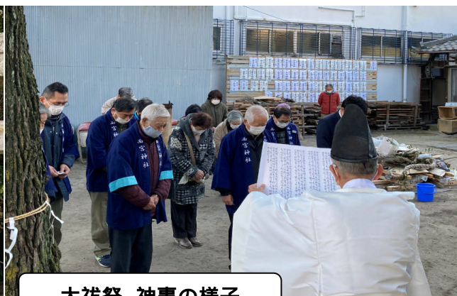
大祓祭 神事の様子