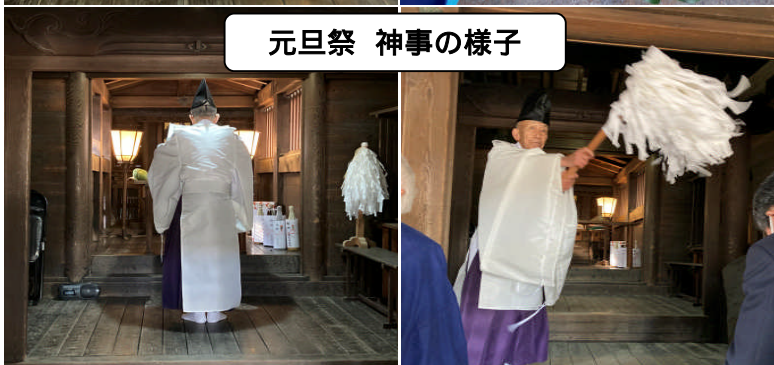
元旦祭 神事の様子