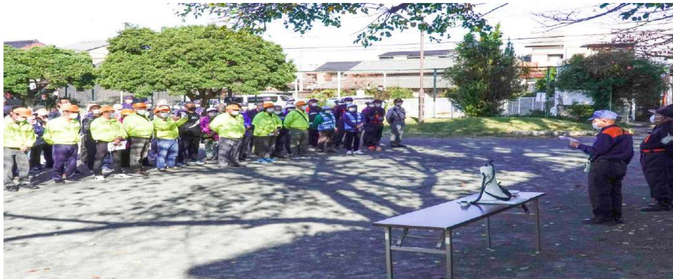
各町内自主 防災会標旗