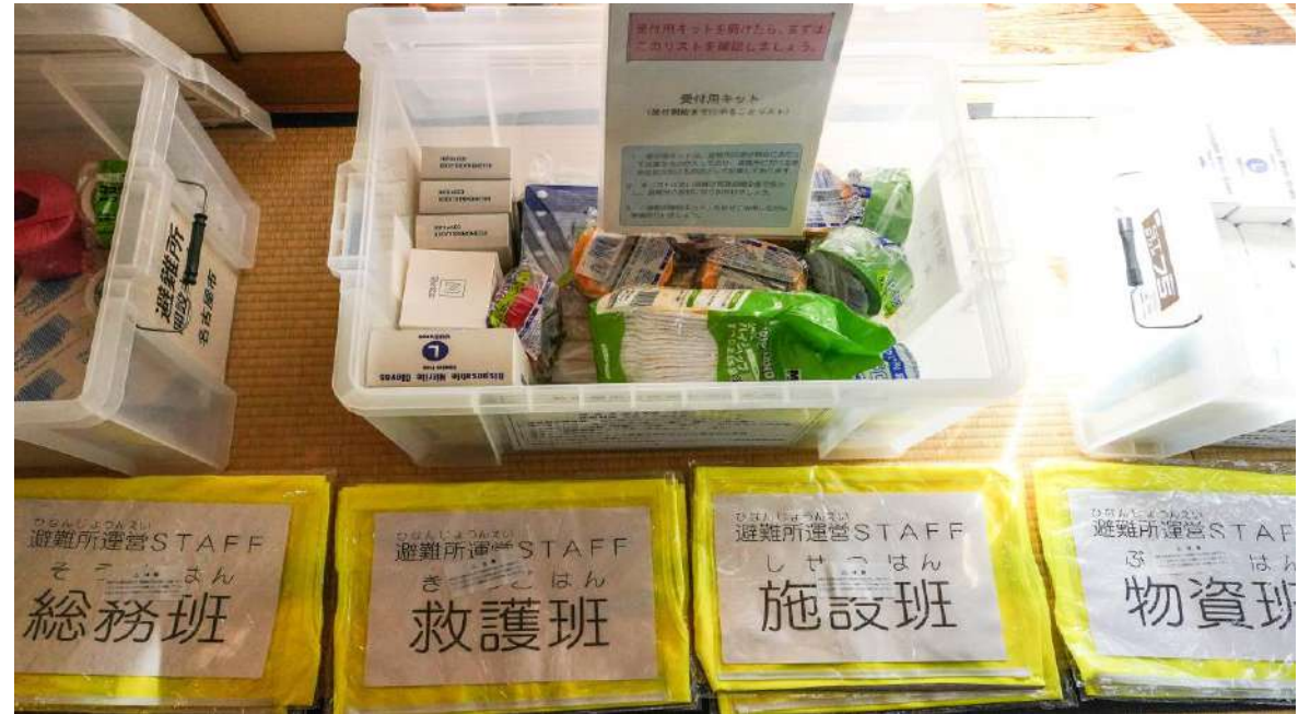
「災害救助用衛生用品」