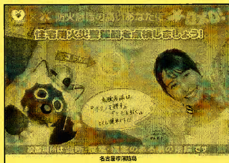
<B3・A3 サイズポスター>